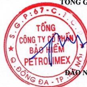
ĐẠO NAM HẢI